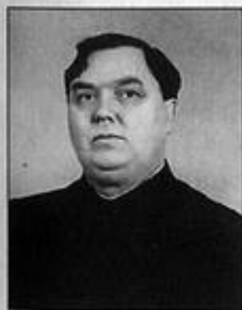
Г. М. Маленков — член ГКО