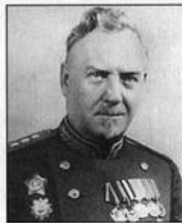
Н. А. Булганин — член ГКО