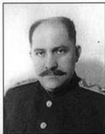
Л. М. Каганович — член ГКО