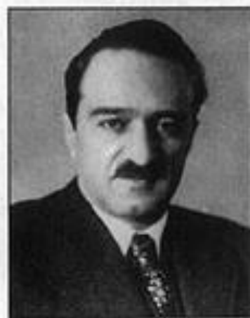
А. И. Микоян — член ГКО