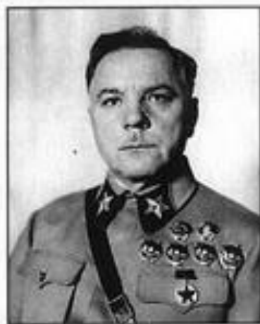
К. Е. Ворошилов — член ГКО