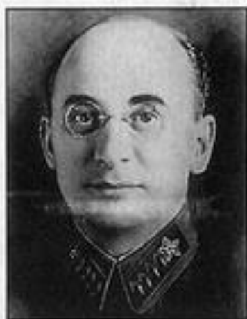
Л. П. Берия — зам. Председателя ГКО