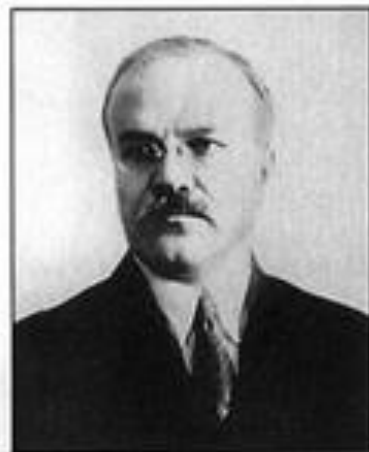
В. М. Молотов — зам. Председателя ГКО