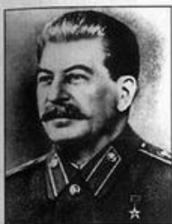
И. В. Сталин — Председатель ГКО