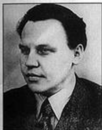
Н. А. Вознесенский — член ГКО